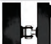
Scharnier 90° opendraaiend