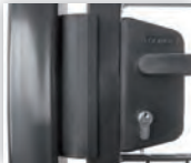
Sluiting d.m.v. een Locinox slot