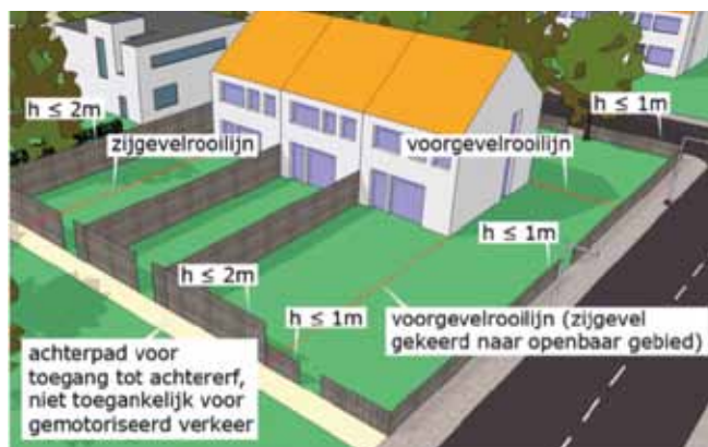
De tekening laat zien in welke gevallen een afscheiding zonder omgevingsvergunning mag worden geplaatst

Op eigen erf of perceel en op of tegen de grens van het naburig erf of perceel mag u vrijwel altijd vergunningvrij een scheidsmuur of andersoortige afscheiding plaatsen die lager is dan 1 meter. Of het