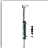
t.b.v. dubbele poort