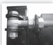
Scharnier 180° opendraaiend, 4-Dimensionaal regelbaar