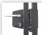
Sluiting d.m.v. een Locinox slot met veiligheidsaanslag type Secura