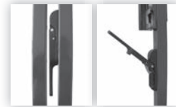
Poortvleugel standaard voorzien van 1 vergrendelstang Suby (alleen bij dubbele poort)