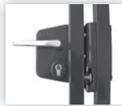
Sluiting d.m.v. een Locinox slot met veiligheidsaanslag type Secura