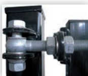
Scharnier 180° opendraaiend, 4-Dimensionaal regelbaar