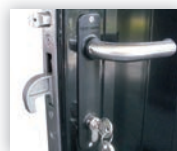
Slot voorzien van RVS valhaak en klink