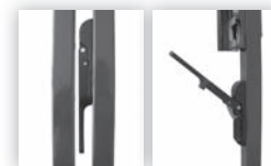
Poortvleugel standaard voorzien van 1 vergrendelstang Suby